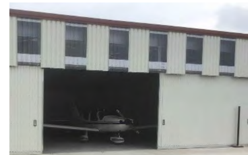
Lichtschrankensender an einem Flugzeughangar für bis zu 72m

Besuchen Sie uns vom 27.09. bis 30.09.2016 auf der Sicherheits-Messe in Essen - Halle 4 , Stand C32