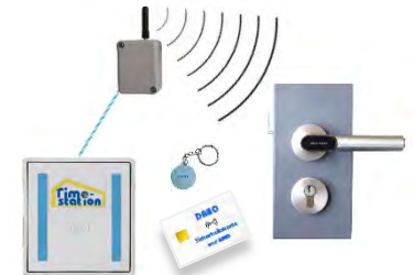
DAKO-TS „Basis“ mit Türöffnung per Funk mit PUK und RFID - Karte

Besuchen Sie uns vom 27.09. bis 30.09.2016 auf der Sicherheits-Messe in Essen - Halle 4 , Stand C32